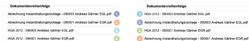
Abb. 423: Ändern der Reihenfolge zusammengefasster Dokumente

Sie ändern die Reihenfolge, indem Sie unter Brief bearbeiten den Brief anklicken und mit gedrückter Maustaste nach oben ziehen.