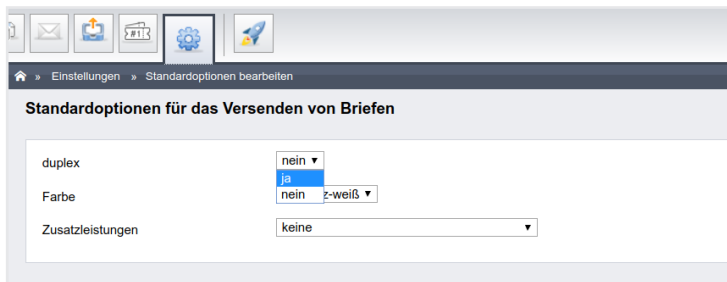
Abb. 415: Auswahl Standardoptionen für E-Post

Sind die Zugangsdaten gespeichert, wählen Sie im Menüpunkt Standardoptionen Ihre Grundeinstellungen aus.