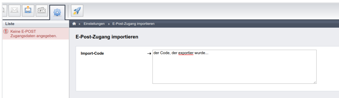
Abb. 417: Import Zugangsdaten

Im zweiten Mandanten öffnen Sie im Einstellungsmodul unter den Menüpunkt Postausgang – Zugang durch Klick auf den Button importieren in der Fußleiste eine Maske, in die Sie den zuvor kopierten Export-Code eingeben.